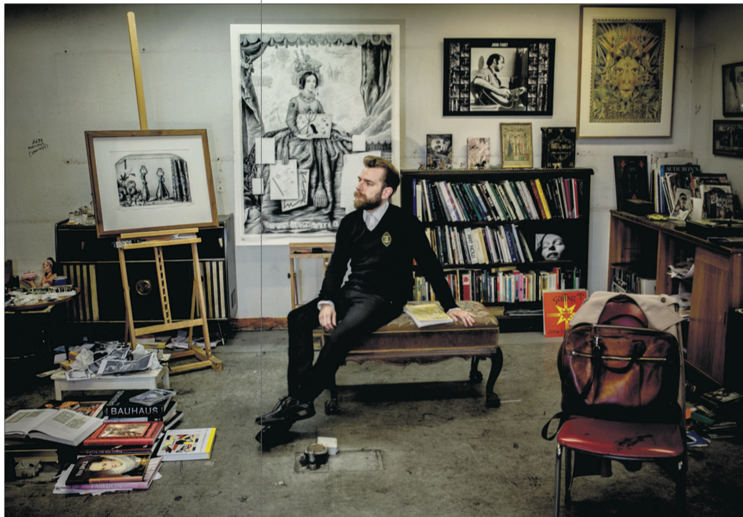
KLAR MED NYE BILDER: – Jeg prøver å finne berøringspunkter mellom det som åpner på Galleri Haaken i morgen.

– Den barokke framtoningen til kvinnen som er avbildet, bryter med de Bauhausinspirerte plakatene i forgrunnen. Det er et ønske om